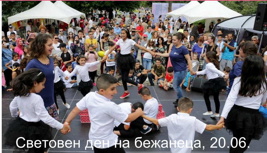
Световен ден на бежанеца, 20.06.

Refugee Month 2020 Месец на бежанците 2020